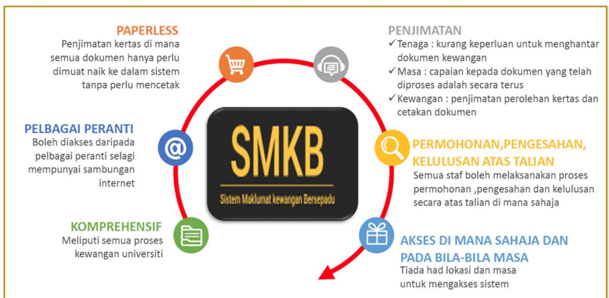
Rajah 2: Fokus utama SMKBv4.0

5.3 Fokus utama pelaksanaan SMKBv4.0 ini adalah seperti berikut: